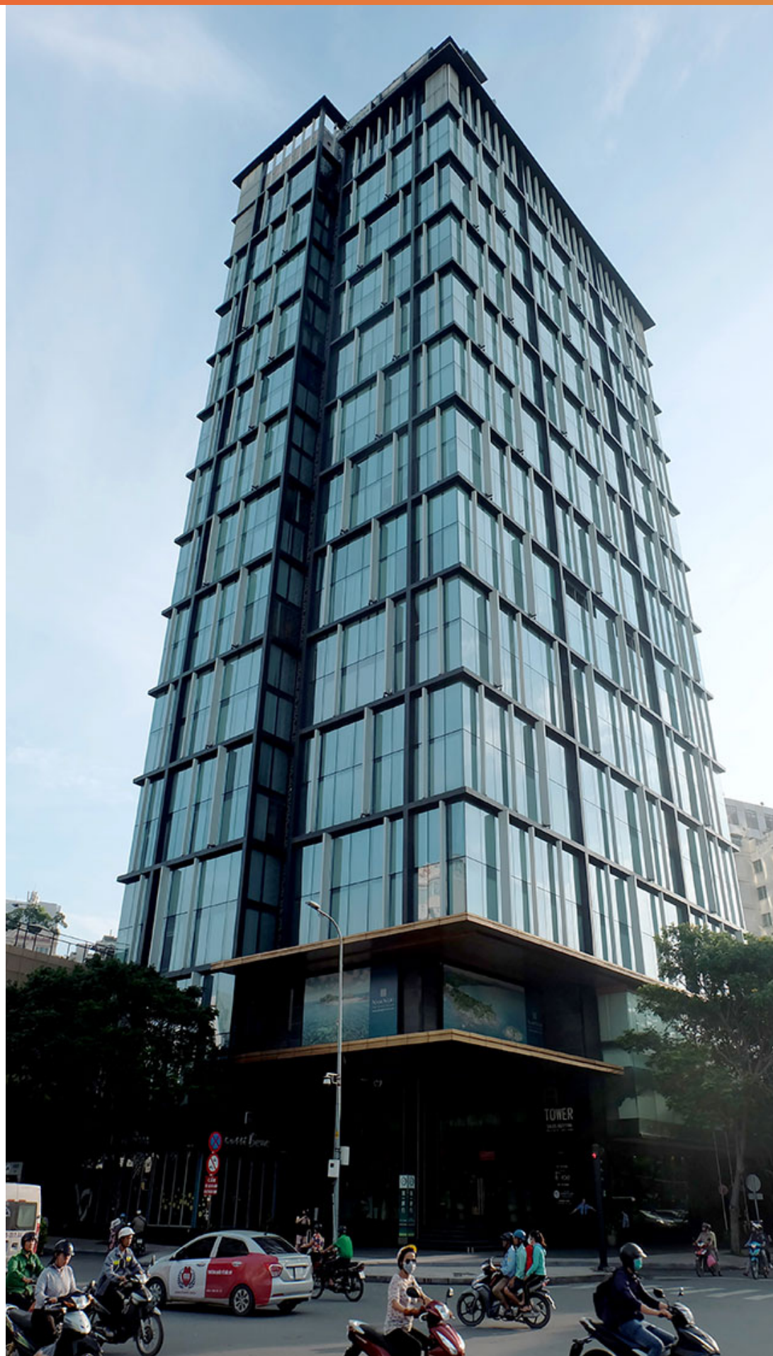
サポートセンターが入るビルの外観です。